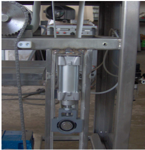
Tensionamento nastro pneumatico